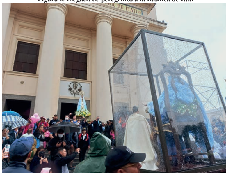
Figura 2. Llegada de peregrinos a la Basílica de Itatí

Luego de dos años sin poder realizarse por la situación sanitaria ocasionada por el coronavirus, la columna de fieles llegó hasta la Casa de la Virgen en su 122ª peregrinación: muchos para agradecer y otros para pedirle un favor a nuestra Madre. 3