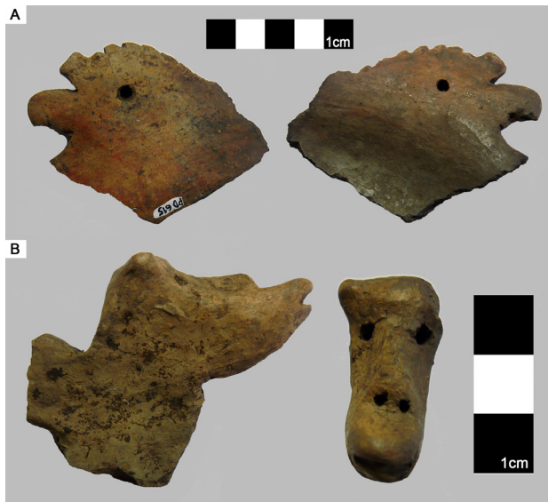
Figura 2. Apéndices zoomorfos recuperados en FP3: A: Psittacidae ; B: Atelidae .

En cuanto a los factores tafonómicos, ambos sectores se vieron afectados por todos los atributos relevados, aunque con algunas diferencias de intensidad. En FP2 se observaron marcas de raíces en un 12,93% (n=93), mientras que las trazas generadas por roedores se relevaron sólo en un 0,83% (n=6). Acerca de las depositaciones químicas, el manganeso afectó la muestra en un 31,71% (n=228) y el hollín en un 10,29% (n=74).